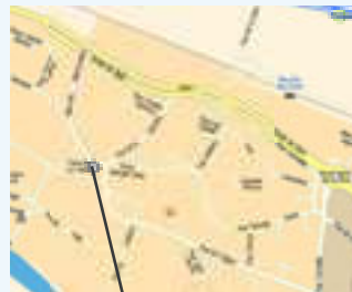
Centre polyvalent Place de la Liberté 21800 Neully-lès-Dijon